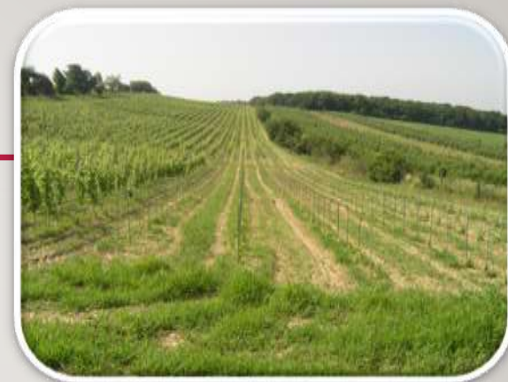
BADEL 1862 d.d.